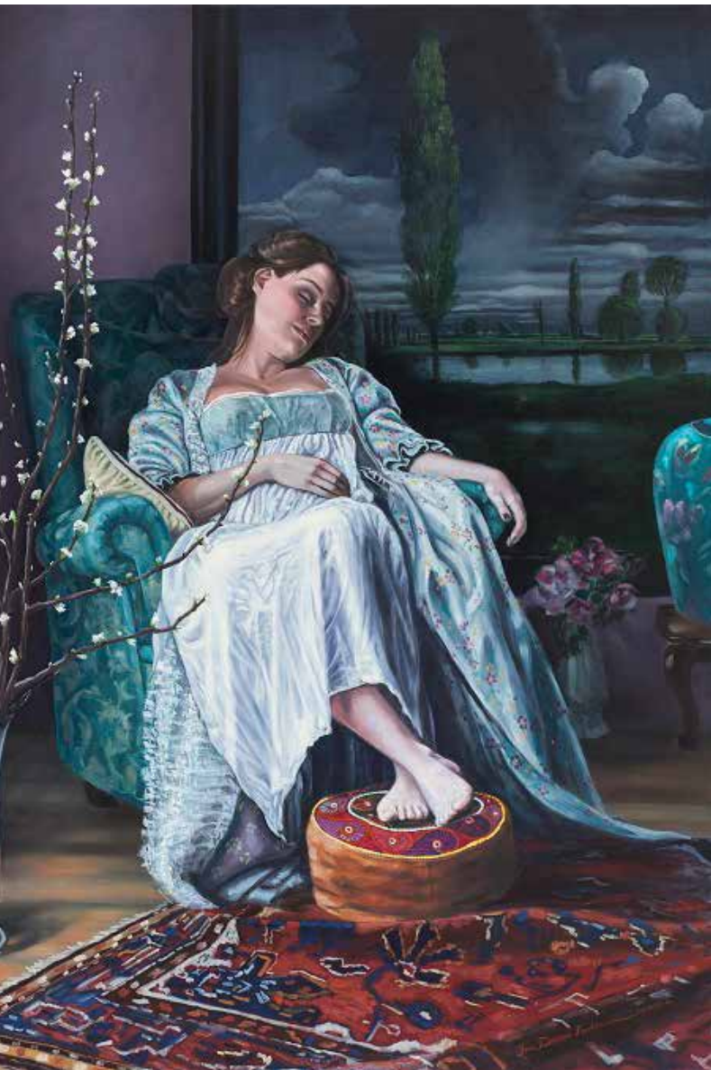
Vanaf linksonder met de klok mee: 'Provence doorkijk' (2013), 'Rust' (2012), 'Villa Bramosia' (2014), 'Provence doorkijk' (2013), 'Circusboy, ode aan Mancini' (2013), 'Verwachtingsvol' (2012).